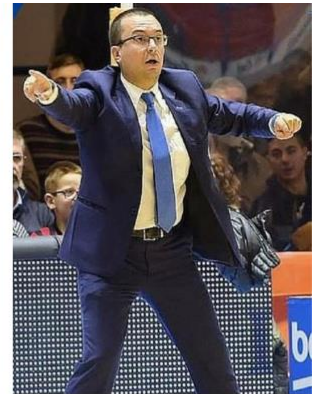
Direttore tecnico del Camp